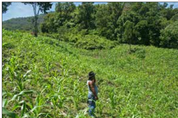
Figura 3. Kila y el trabajo chatino. Autor: Gerónimo Barrera de la Torre, archivo de campo, julio de 2014.

Como hemos descrito, dentro del trabajo de campo se incorporaron técnicas cercanas a la