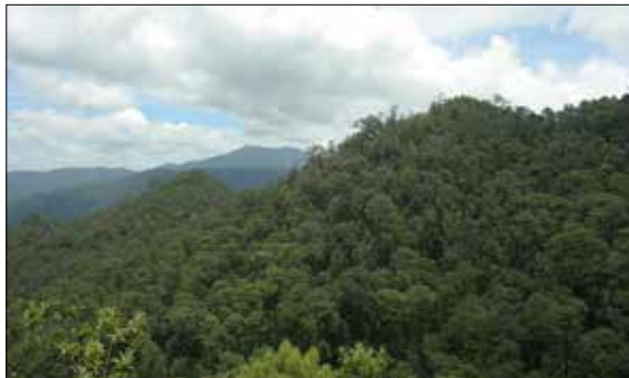
Figura 5. Cerros, montañas y bosques. Recorrido por K'qya-c stanq-a (“Cerro de Rama”). Autor: Gerónimo Barrera de la Torre, archivo de campo, agosto de 2014.

Considero pertinente terminar este texto remarcando la importancia de dar continuidad al trabajo