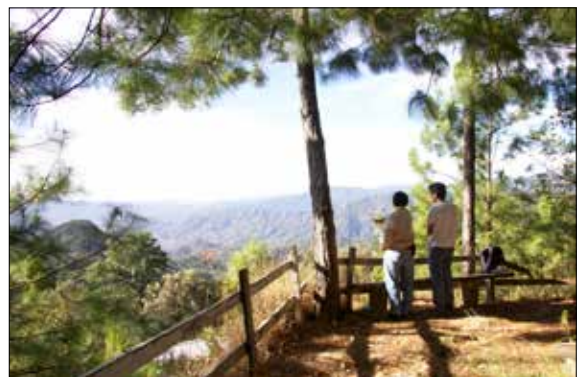
Figura 1. Reflexiones en torno al paisaje Chatino.

Como he mencionado, la investigación tuvo como objetivo central aproximarse a la relación del pue-